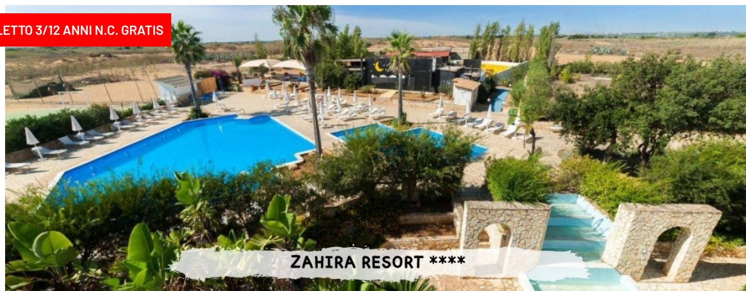
ZAHIRA RESORT ****