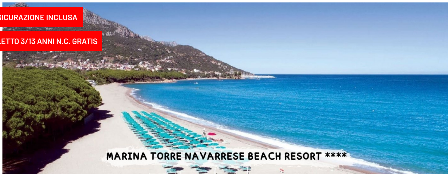
MARINA TORRE NAVARRESE BEACH RESORT ****